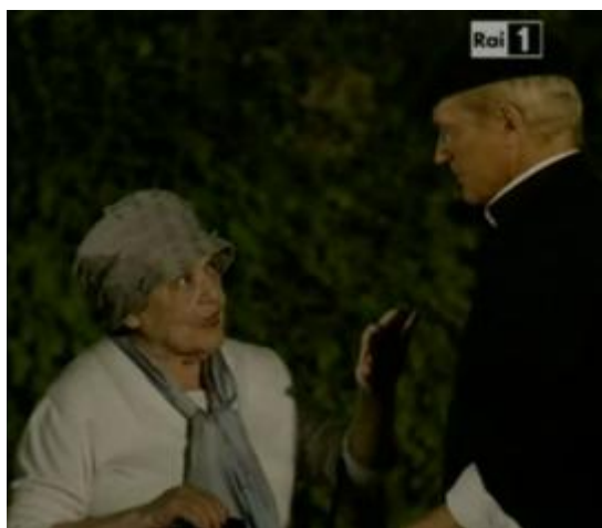
Terence Hill al fianco di Isa Bellini in Don Matteo 8