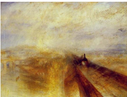
William Turner – Rain, steam, and speed / The Great Western Railway (1844)

Da notare il valore artistico di queste due copertine, disegnate, entrambe, da Nisa! Particolarmente nel caso di Fischia il vapor , non ricorda, per la posizione e lo stile del soggetto, le due opere qui sotto proposte?