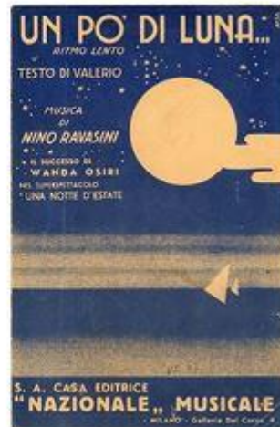
UN PÒ DI LUNA - Trio Villalba

Da notare il valore artistico di queste due copertine, disegnate, entrambe, da Nisa! Particolarmente nel caso di Fischia il vapor , non ricorda, per la posizione e lo stile del soggetto, le due opere qui sotto proposte?